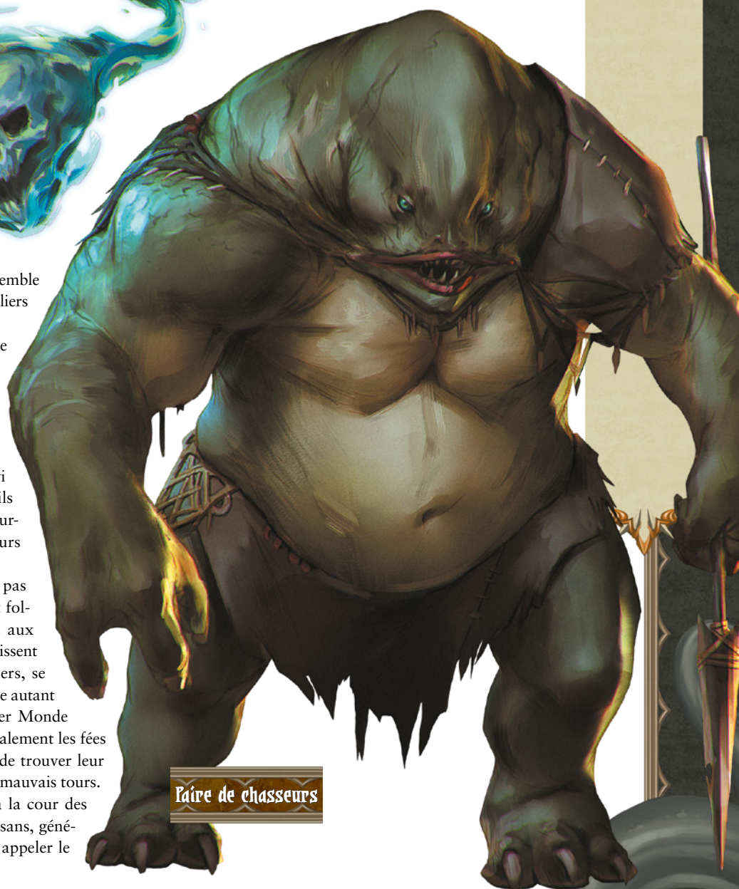
Paire de chasseurs