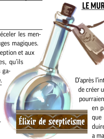
Élixir de scepticisme