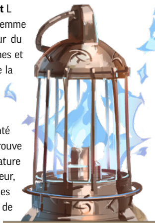
Lanterne de lumière creuse

d'une façon ou d'une autre, à la luisance d'un fantôme lorsqu'il est consommé par la déesse Extérieure Nhimbalth. Une lanterne de lumière creuse n'est pas un objet intrinsèquement mauvais, bien qu'il reste un outil apprécié de ceux qui manipulent les esprits pour de sinistres raisons. On peut l'utiliser comme une lanterne à capote ordinaire, mais l'utilisateur, s'il l'utilise trop longtemps, aura la vague impression d'être observé par des yeux invisibles.